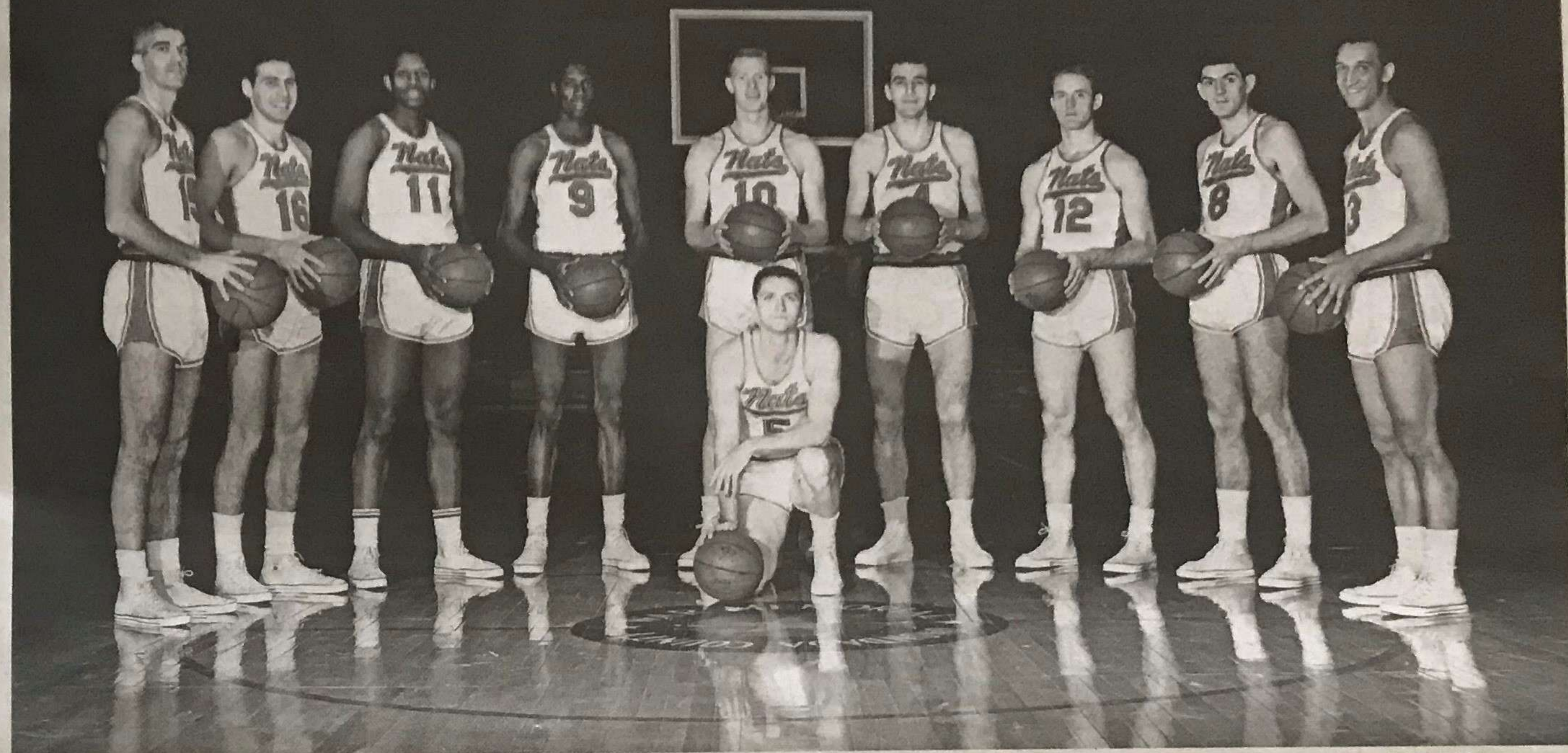
Het NBA-team van de Syracuse Nationals (tegenwoordig de Philadelphia 76ers) poseert voor een teamfoto in de Onondaga War Memorial Arena in Syracuse, New York. Met in hun midden de zwarte spelers Earl Lloyd (11) en Bob Hopkins (9). Onder: de Uline Arena (later hernoemd tot Washington Coliseum) in Washington.