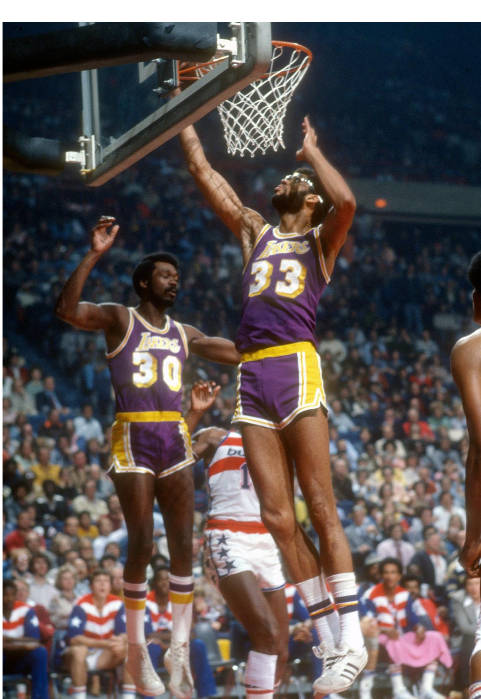
Kareem Abdul-Jabbar (nummer 33) in 1978 in actie voor de Los Angeles Lakers in een duel met de Washington Bullets.

James dankt het puntenrecord aan zijn mentaliteit en zijn sterke fysieke gesteldheid. Als 38-jarige sprinter hij, ondanks zijn overvolle prijzenkast, jonge spelers nog steeds voorbij alsof hij nog alles te bewijzen heeft. In twintig zware NBA-seizoenen speelde hij al bijna 1700 wedstrijden. Ter vergelijking: topvoetballer Messi (35) speelde tot op heden iets meer dan duizend wedstrijden op het hoogste niveau.