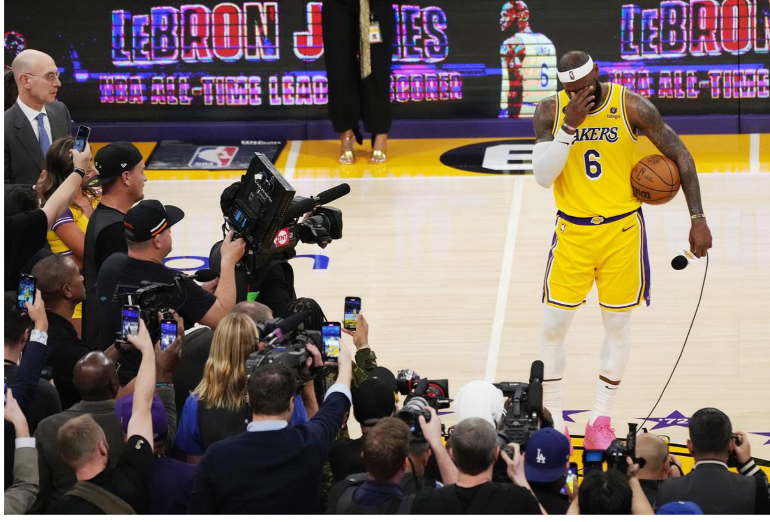
LeBron James van de Los Angeles Lakers wordt emotioneel nadat hij de topscorer aller tijden in de NBA is geworden.

LeBron James (38) is de meest scorende NBA-basketballer ooit. Tijdens de wedstrijd tegen Oklahoma City Thunder (130-133) overtrof hij Kareem Abdul-Jabbar, die het record bijna 39 jaar in handen had.