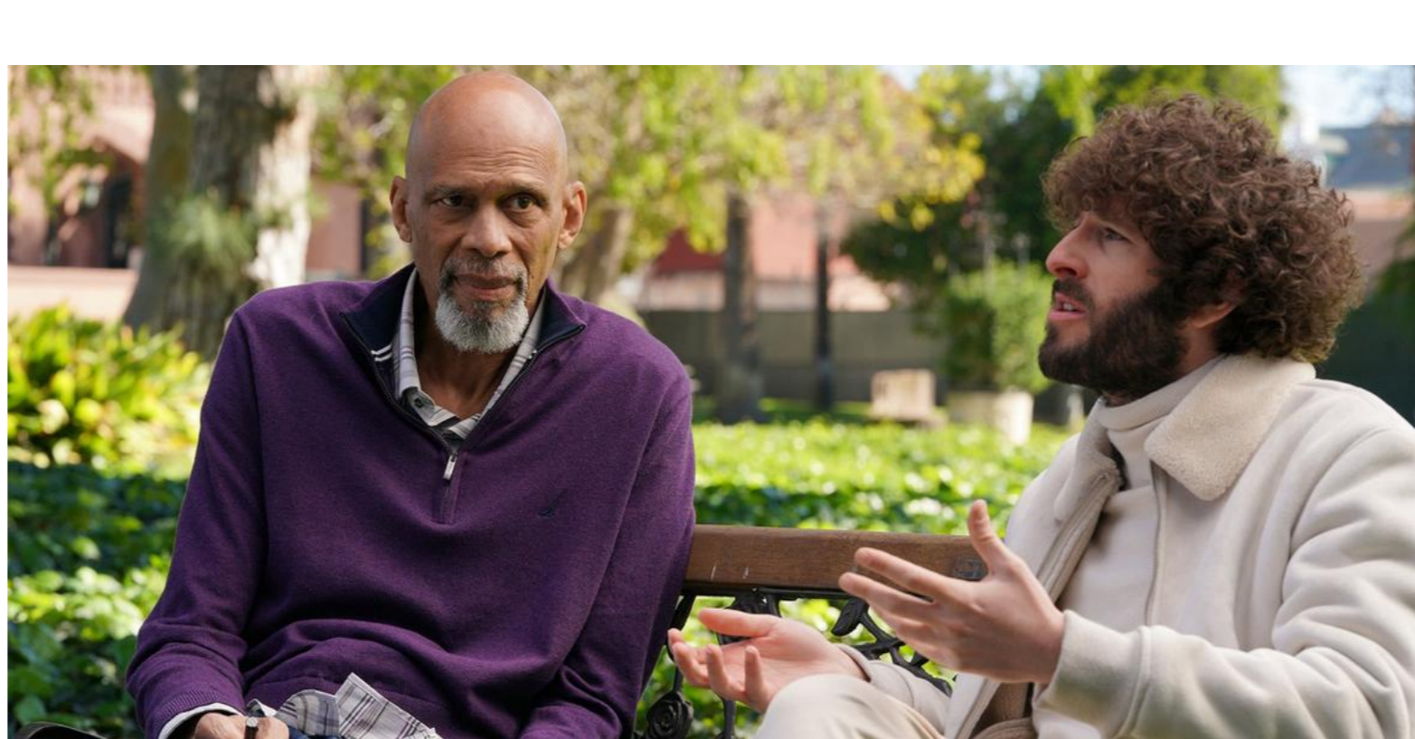
Kareem Abdul-Jabbar in 2021, in gesprek met Dave Burd, beter bekend als rapper Lil Dicky.

Abdul-Jabbar was niet de eerste zwarte basketballer die op zo'n manier buiten het veld van zich liet horen. De impact was bij hem echter groter omdat hij zo goed was. Dat vond bijvoorbeeld ook de NBA, die in 2021 de jaarlijkse Kareem Abdul-Jabbar Social Justice Award in het leven riep, voor spelers die zich op een of andere manier bijzonder inzetten voor hun eigen gemeenschap en de maatschappij in bredere zin.